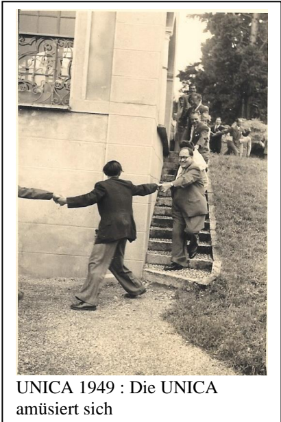
UNICA 1949 : Die UNICA amüsiert sich